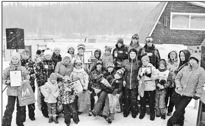
Традиционная благотворительная акция «День добра», которую волонтеры Кемеровского отделения Красного

Кузбассовцы собрали более 700 тысяч рублей на «Дне добра». Сотни отдыхающих, спортсменов и их болельщиков собрались на горах «Туманная» и «Зеленая», чтобы сделать доброе дело, продемонстрировать свои спортивные таланты в горнолыжных соревнованиях на «Кубок Благотворителя «Золотая Шория» и побывать в гуманитарной деревне Красного Креста.